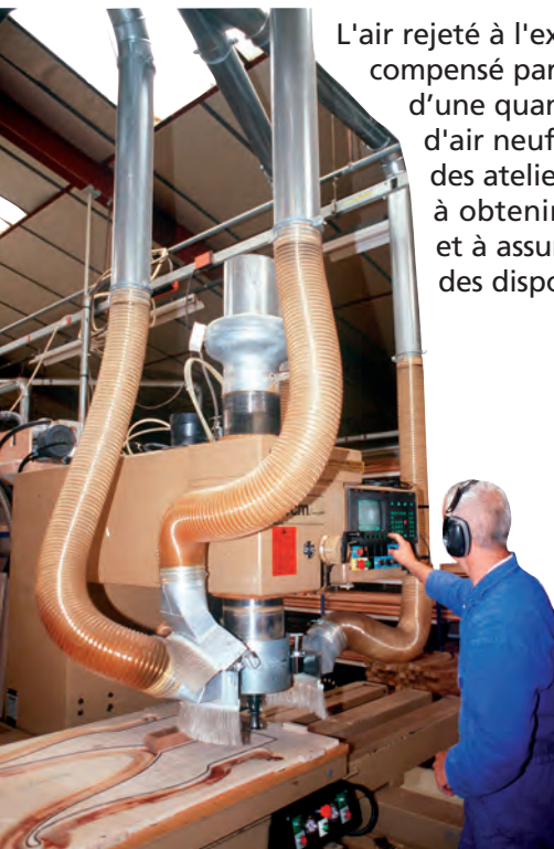
Un secteur du capot a été déposé

L'air rejeté à l'extérieur doit être compensé par l'introduction d'une quantité équivalente d'air neuf, pris à l'extérieur des ateliers, de manière à obtenir les débits requis et à assurer l'efficacité des dispositifs de captage.